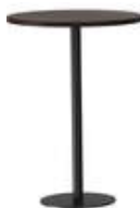
RQ Light t-2007