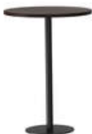
RQ Light t-2007