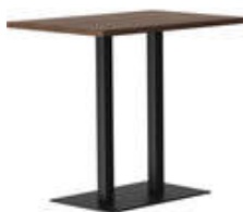
RQ Light t-2008